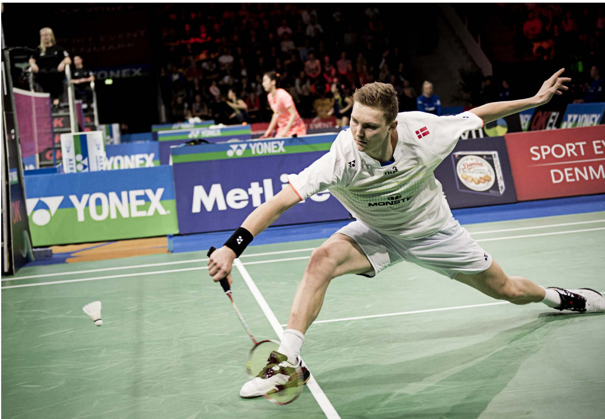
■ Viktor Axelsen nåede stort set alt i kvartfinalen mod Lin Dan. Efter kampen takkede han publikum for den markante støtte. Lørdag gælder det verdenssetter Chen Long.